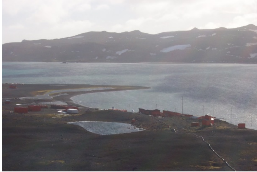
Figura 1: Base antártica Carlini sobre caleta Potter en la Isla 25 de Mayo.